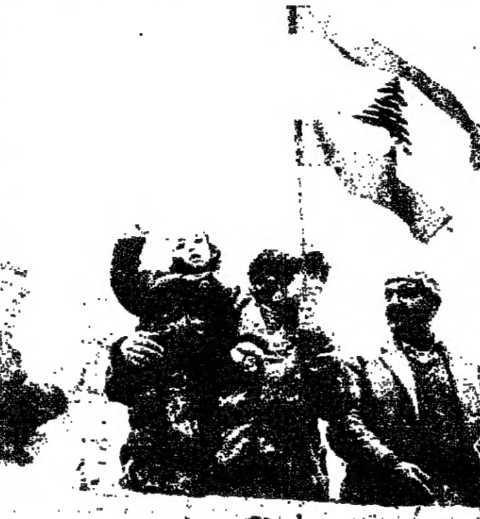
من كل الاجيال